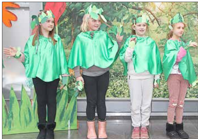
Kinder der Freien Grundschule Riestedt umrahmten die Festveranstaltung mit Musik und einem Theaterstück.

ein wichtiger Beitrag dazu. Herzlichen Dank für Ihre Arbeit in den vergangenen 30 Jahren und alles Gute, für die kommenden Jahre und Jahrzehnte!“