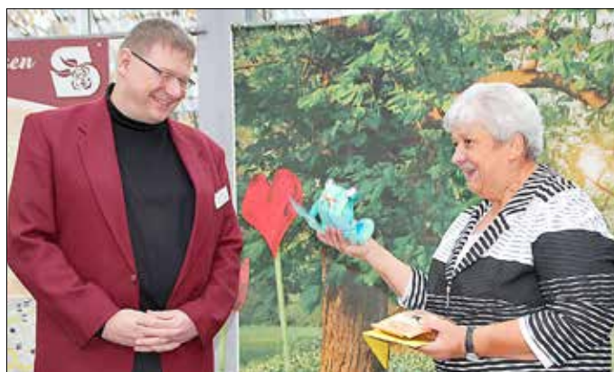
Auch die Ehemaligen gratulieren natürlich mit einem Frosch.