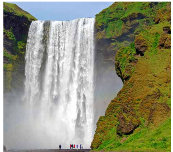
Roland Kock präsentiert die atemberaubenden Landschaften Islands, hier der Wasserfall Skogafoss.

Sangerhausen, Glashaus des Europa-Rosariums