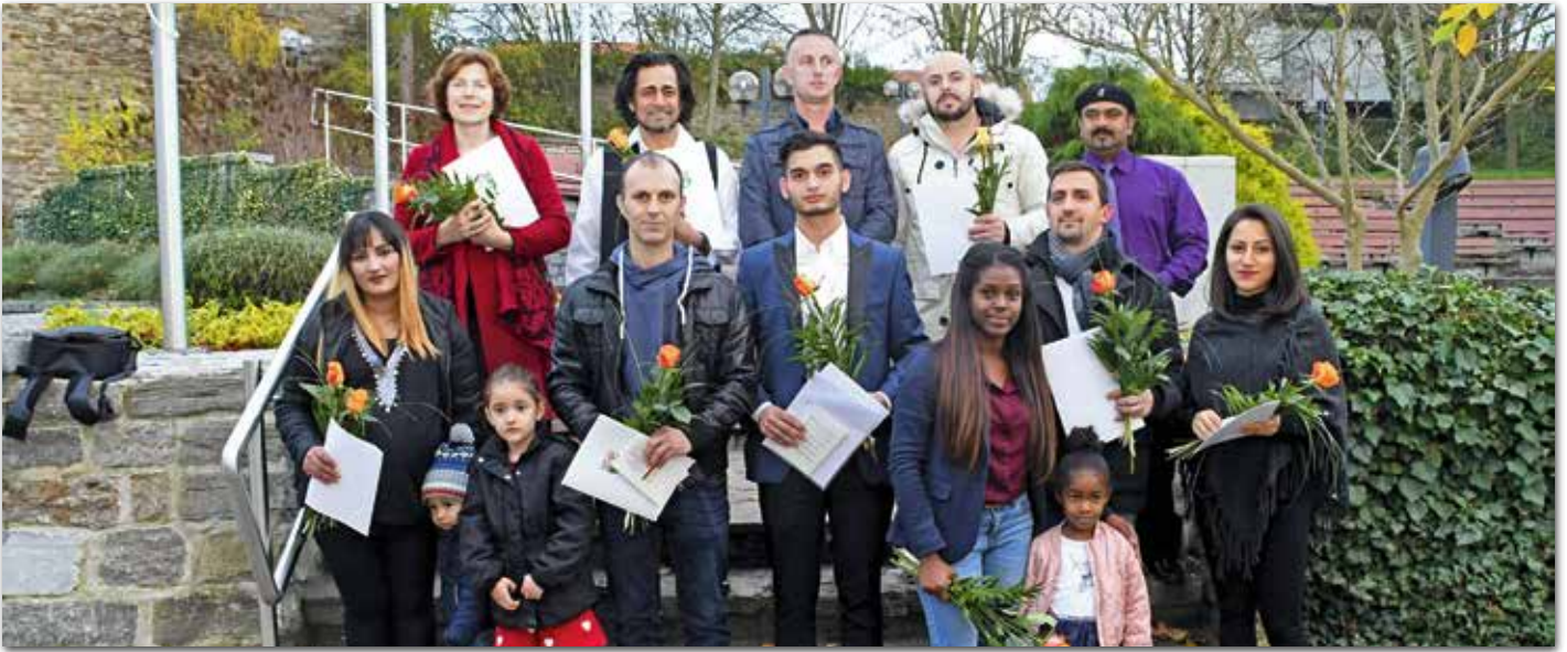
Anfang November wurden 15 Personen in der Kreismusikschule Mansfeld-Südharz in Sangerhausen offiziell eingebürgert.

Mansfeld-Südharz sei seit Jahrhunderten - bedingt durch den Bergbau - eine Einwanderungsregion gewesen, die Menschen aus vielen Völkern aufnahm. Wenn die nun Eingebürgerten sich aktiv in die Gesellschaft einbringen, sei dies ein erster Schritt für eine erfolgreiche Integration.