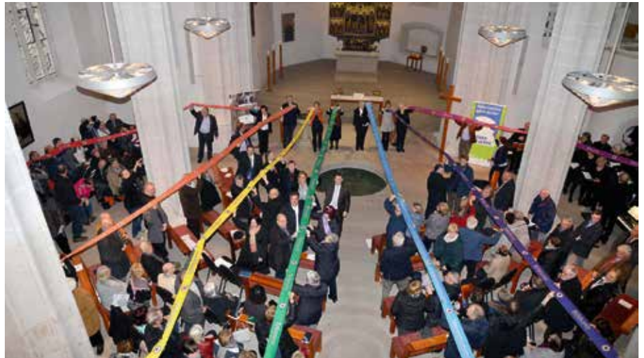
Während der gut besuchten Abschlussveranstaltung im Zentrum Taufe wurden auch Bänder mit Themen der Reformationsdekade „Vielfalt, Verantwortung, Freiheit, Toleranz, Bildung, Musik und Vertrauen“ entrollt.

dieses Kulturdenkmals eingerichtet. Auch Kinder und Jugendliche brachten sich in verschiedenen Aktionen ein. Schülerinnen und Schüler des Wilhelm-und-Alexander-von-Humboldt-Gymnasiums haben Schulen entlang des Lutherweges eingeladen, mit ihnen den Lutherweg von Lutherstadt zu Lutherstadt zu gehen, sich mit dem Thema Reformation auseinanderzusetzen und eigene Thesen zum Thema zu formulieren. Hervorzuheben ist auch das Theaterprojekt #Thesen 9.5, das Jugendliche aus der Region entwickelt und mit dem Theater Eisleben sowie weiteren Partnern umgesetzt haben. Auch wurde im Landkreis die Idee des Mansfelder Song und Slam Festivals geboren und auf den Weg gebracht. Noch ist es ein Pflänzchen, das wachsen und überregional ausstrahlen möchte, aber künftig seinen festen Platz am dritten Augustwochenende im Veranstaltungskalender der Region einnehmen soll.