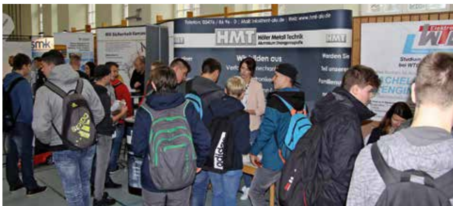
Dichtes Gedränge herrschte zur 9. Berufsorientierungsmesse ZACK nahezu an allen Ausstellerständen.