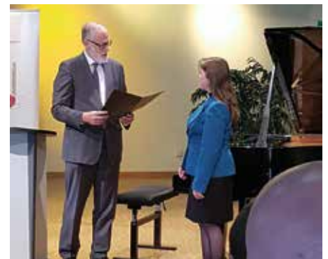
Die Leiterin der Kreismusikschule Mansfeld-Südharz, Peggy Bitterolf, erhält die Urkunde zur Staatlichen Anerkennung von Rainer Robra, Chef der Staatskanzlei und Minister für Kultur in Sachsen-Anhalt.

Neben neun weiteren Musikschulen aus Sachsen-Anhalt hat die Kreismusikschule Mansfeld-Südharz jetzt in Magdeburg die Urkunde für die "Staatliche Anerkennung" erhalten. Im Anschluss an die 27. Mitgliederversammlung des Landesverbandes der Musikschulen Sachsen-Anhalt e.V. überreichte Rainer Robra, Chef der Staatskanzlei und Minister für Kultur in Sachsen-Anhalt, die Urkunde an die insgesamt zehn Musikschulen in Sachsen-Anhalt.