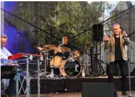
Zum 2. Mansfelder Song und Slam Festival gastierte auch die Band LIFT in historischem Ambiente des Schlosses Mansfeld. Eine Neuauflage des Festivals ist für August 2018 geplant.

Rückblickend waren sich alle Gäste einig, dass es sehr viele und vielfältige Höhepunkte, Aktionen und Veranstaltungen im Reformationsjahr gab. So wurde neben der Wiedereröffnung des sanierten Annenklosters in der historischen Eisleber Neustadt mit den einzigartigen Mönchszellen auch eine Dauerausstellung zur Bau- und Nutzungsgeschichte