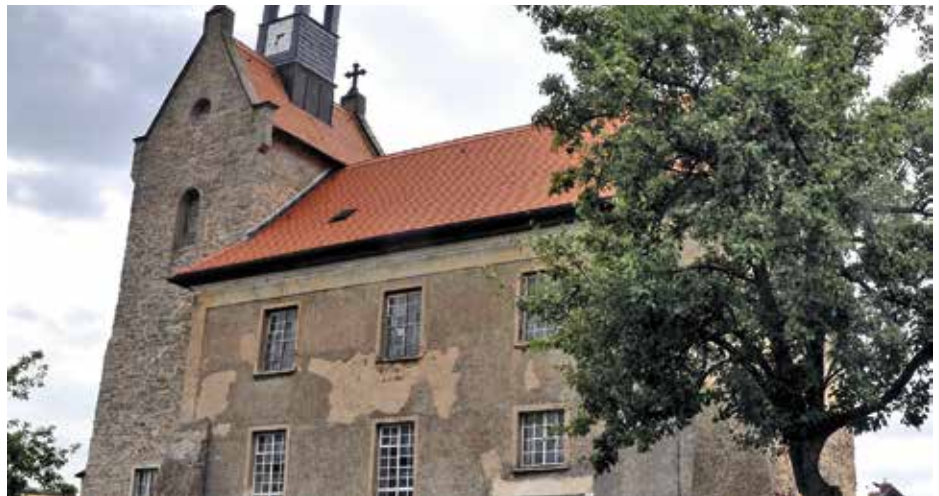
Das Evangelische Pfarramt Mansfeld erhält für die dringend notwendige Fassadeninstandsetzung der St. Bonifatiuskirche in Vatterode eine Zuwendung in Höhe von 10.000 Euro.

Im ersten Halbjahr 2017 hatte der Zukunftsfonds rund 482.000 Euro erwirtschaftet. Die Mitglieder des Kreisausschusses entschieden nach intensiver Diskussion über die einzelnen Anträge, folgende Maßnahmen werden in dieser Antragsrunde gefördert: