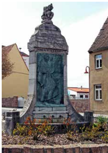
Auch der Lutherbrunnen in Mansfeld war eine Station auf dem Weg der Wanderer.